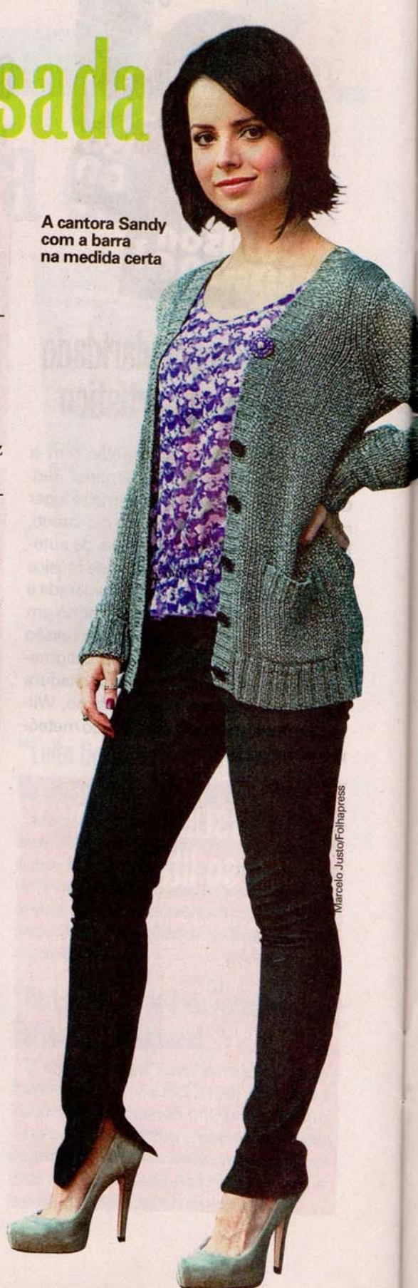
A cantora Sandy com a barra na medida certa

Em alta, a calça boyfriend — mais larga, o que dá a impressão de a garota estar usando a calça do namorado — deve ser dobrada até a altura dos tornozelos. Mas atenção: “A proposta não é transformar a calça em capri, mas encurtá-la de maneira sutil”, orienta Andreia. E tome cuidado com o tipo de modelo escolhido. “As calças com bocas mais largas não proporcionam um resultado final interessante. As barras retas ou levemente afuniladas são perfeitas”, ensina.