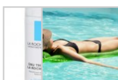
Água Termal – La Roche Posay