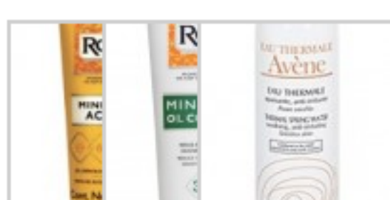
Minesol Minesol Água Actif – Oil Termal – RoC Control – Avène RoC