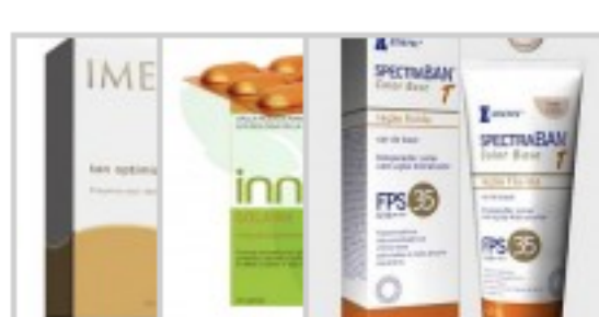
Tan Solar – SpectraBAN Optimizer Innéov – Stiefel – Imedeem

Pós-sol: acalmam a pele e repõem nutrientes. Exemplos: Água Termal Avène, Água Termal La Roche Posay