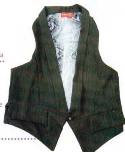
Colete Risca de Giz Smoking, por R$109,00 da French B