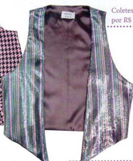
Coletes de listras e paetês, por R$ 195, da Juliana Ariza