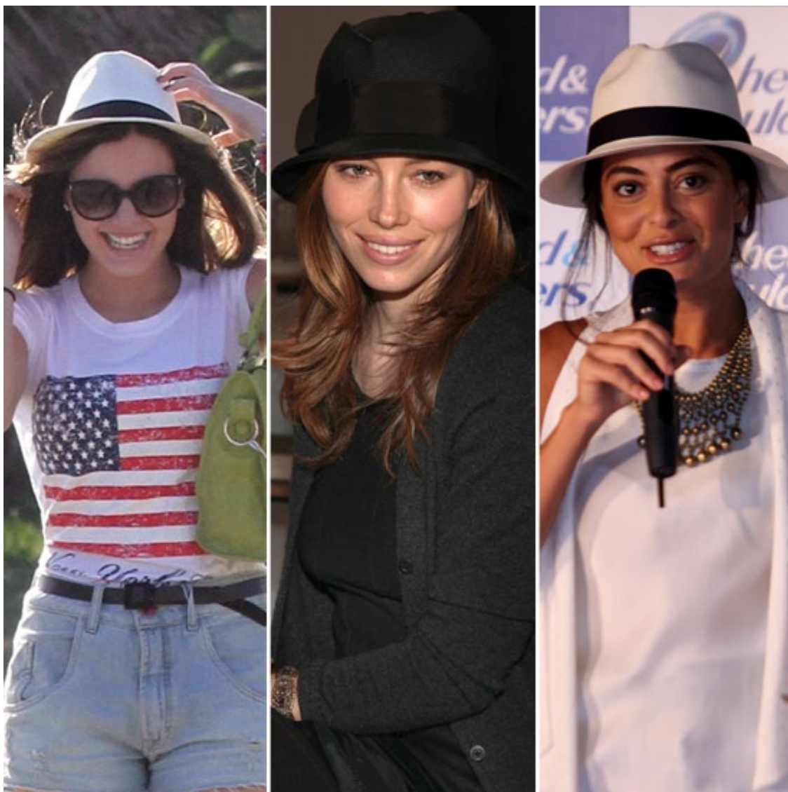
Giovanna Lancellotti, Jessica Biel e Juliana Paes já apostaram na moda do chapéu.

1. O chapéu pode, sim, ser usado com penteado! Encana-se quem pensa que o chapéu só deve