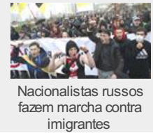
Nacionalistas russos fazem marcha contra imigrantes