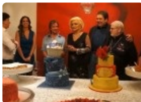
Divulgado vídeo inédito de Hebe Camargo em seu último aniversário