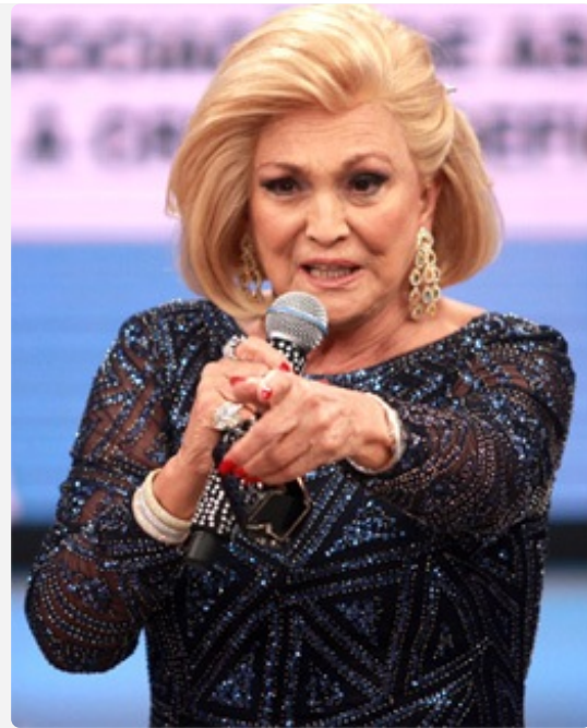
Brilhos e transparência

Com o tempo fui conhecendo melhor sua história e ela se transformou em um ídolo para mim. Hebe entre mil e um motivos que a tornam incrível e extremamente especial, ousou trabalhar na televisão em uma época em que o fato da mulher trabalhar fora de casa, e ainda mais na mídia, não era bem visto pela sociedade; chamou a atenção para a importância da sociedade brasileira tornar-se mais politizada, pois seus discursos denunciavam escândalos que estavam acontecendo no cenário político do país, e em entrevistas não tinha receio de expressar sua opinião sobre assuntos tidos como tabu.