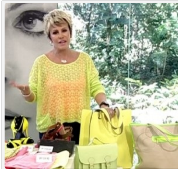
Ana Maria Braga usando neon em pauta sobre o tema em seu programa

A boa notícia, para quem tinha aderido a essa moda há 2 anos atrás, é que agora poderá tirar do armário suas peças “iluminadas”, mas para quem não tem peça alguma nas cores da moda, convém seguir algumas dicas para não se arrepender e fazer a compra valer a pena: