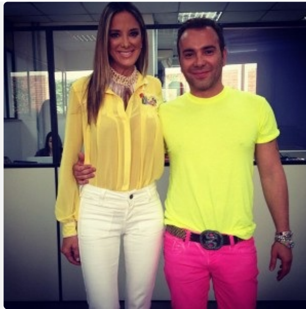
Ticiane Pinheiro e Matheus Mazzafera